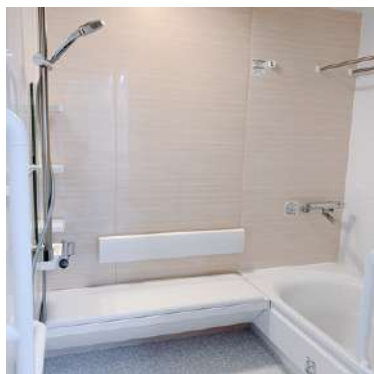
少しゆったりめの浴室