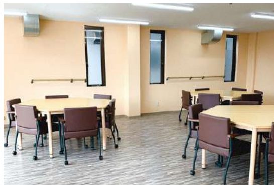
ダイニングルーム